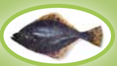
Flądra - 20 cm