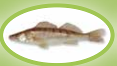
Sandacz - 42 cm