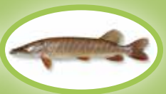
Szczupak - 45 cm