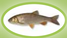
Kleń - 30 cm