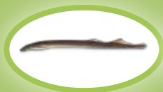
Minóg rzeczny - 20 cm