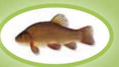
Lin - 25 cm

W przypadku złowienia ryby mniejszej niż obowiązujący dla niej wymiar ochronny, należy ją natychmiast wrzucić z powrotem do tego samego zbiornika wodnego!