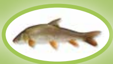
Śliz pospolity - 30 cm