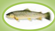
Pstrąg potokowy - 25 cm