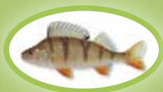
Okoń - 22 cm